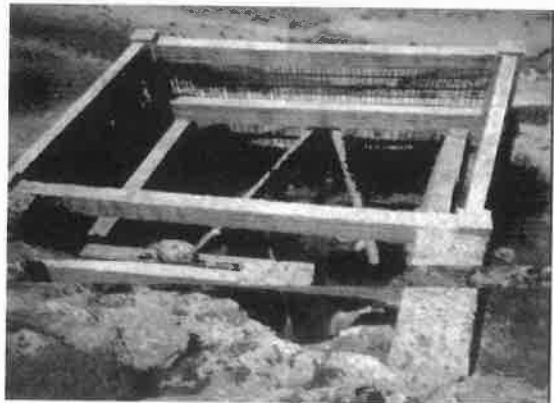
Η μεγάλη καταβόθρα από ψηλά.

Εφοδιασμένοι με σχοινιά και άλλα σύνεργα και ντιμένοι με ειδικές στολές, κατόρθωσαν να φθάσουν σε βάθος 100 και μί-