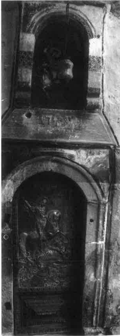
Η σφρηγήλατη θύρα του ναού με την ανάγλυφη εικόνα και το υπέρθυρο εικονοστάσι του Αγίου.

Ως «έτος κτίσεως» της νέας μονής αναφέρεται το 1693. Τη χρονολογία αυτή φέρει η παλαιά σφραγίδα της μονής που βρίσκεται στο Εκκλησιαστικό Μουσείο Κορίνθου. Τη συναντάμε και ανάγλυφη, κοιμμένη στα δύο 16 - 93, στα δύο αγκωνάρια που στηρίζουν τους παραστάτες δεξιά και αριστερά της μεγάλης αυλόπορτας της Μονής. Η νέα μονή με νεώτερο Πατριαρχικό σιγίλιο που ανανέωνε το παλαιό περιεβλήθη και πάλι με τη δόξα και την τιμή του Σταυροπηγιακού Μοναστηριού. Από σιγίλιο 1 του 1740 μαθαίνουμε ότι το μοναστήρι καταστράφηκε από μεγάλη πυρκαγιά και ξαναχτίστηκε το 1745. Τότε άρχισε και η μέχρι σήμερα σωζόμενη, εξαιρετικής τέχνης αιοιογράφιση του ναού και η κατασκευή του ανεκτίμητης αξίας ξυλόγλυπτου τέμπλου.